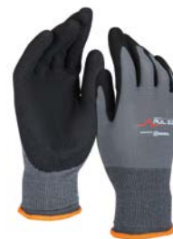
HEREN antraciet 8001 8907 15-97 8-11