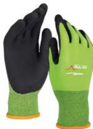
HEREN neon groen 8001 8907 15-63 8-11