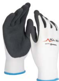
DAMES wit 8001 8909 16-10 6-8