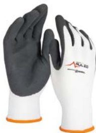
HEREN wit 8001 8907 15-10 8-11