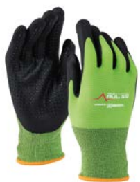
HEREN neon groen 8001 8906 13-63 8-11