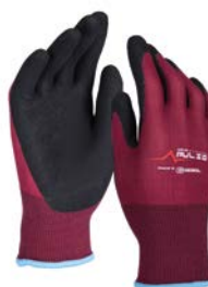
DAMES bordeaux 8001 8909 16-58 6-8