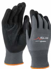
HEREN antraciet 8001 8906 13-97 8-11