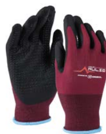
DAMES bordeaux 8001 8908 14-58 6-8