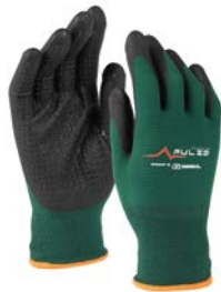
HEREN mosgroen 8001 8906 13-65 8-11