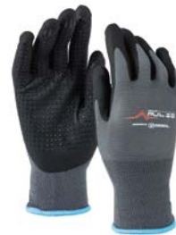
DAMES antraciet 8001 8908 14-97 6-8