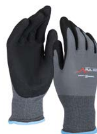
DAMES antraciet 8001 8909 16-97 6-8