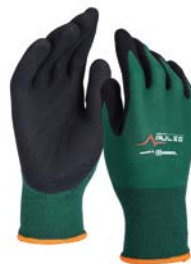
HEREN mosgroen 8001 8907 15-65 8-11